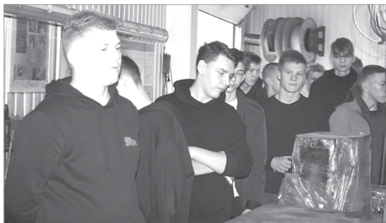
Экскурсия на СТО для первокурсников

23 сентября для студентов 1-го курса была организована экскурсия на СТО «BOSCH – автосервис». Его руко-