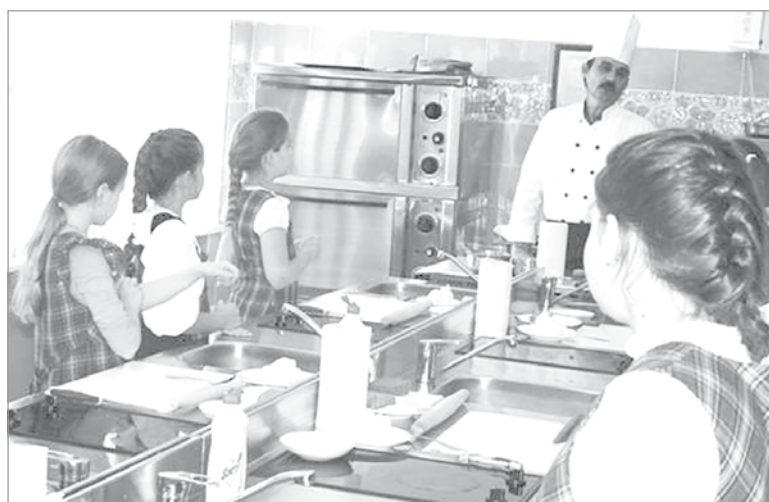
Мастер-класс по выпечке калиток