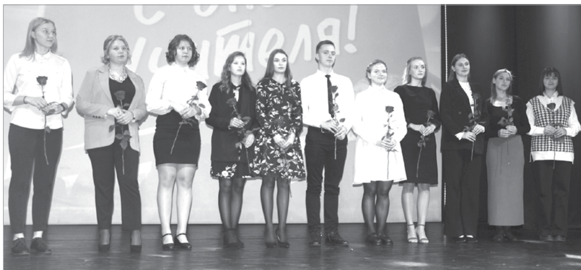
В большую педагогическую семью приняли 11 молодых специалистов