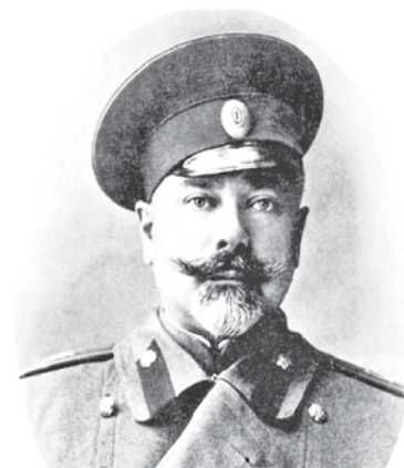
Антон Иванович Деникин, русский военачальник, герой Русско-японской и Первой мировой войн, один из главных руководителей Белого движения

флота был высажен в Копорском заливе для захвата береговых фортов. Красноармейцы вынуждены были отойти в район Шепелево. Однако при помощи моряков и орудий фортов белогвардейцы были оттеснены к реке Коваш. 28 сентября 2-й корпус Западной армии внезапно ударил на Псков. Не разгадав замысла врага, командование 7-й армии РККА, оборонявшей