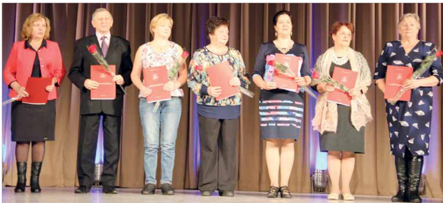
Активисты и руководители первичных ветеранских организаций