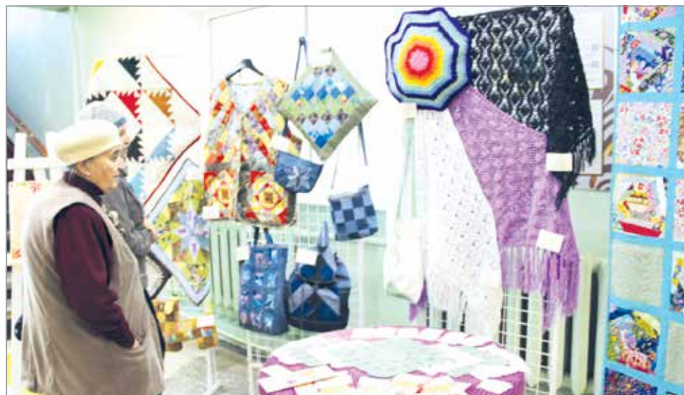
Выставка творческих работ ветеранов