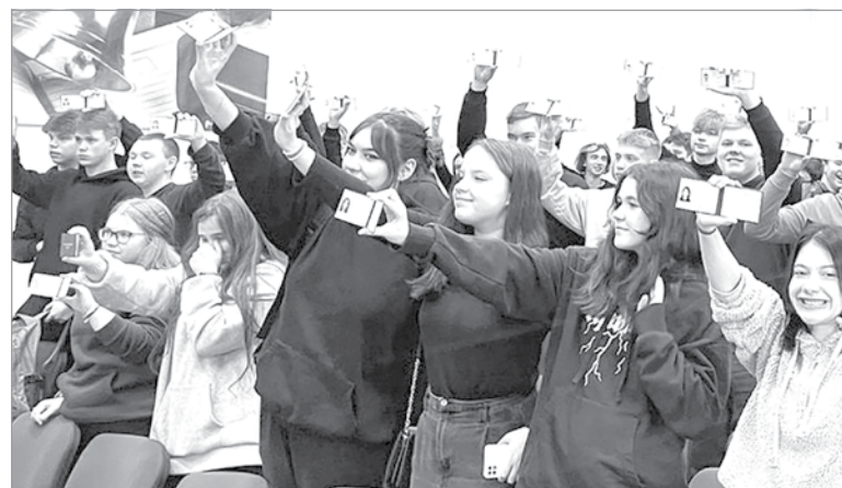
В полку студентов прибыло!

Студенты и преподаватели также приняли участие в дистанционном онлайн-флешмобе #СПОсоботкрытьмир. В своей социальной сети они