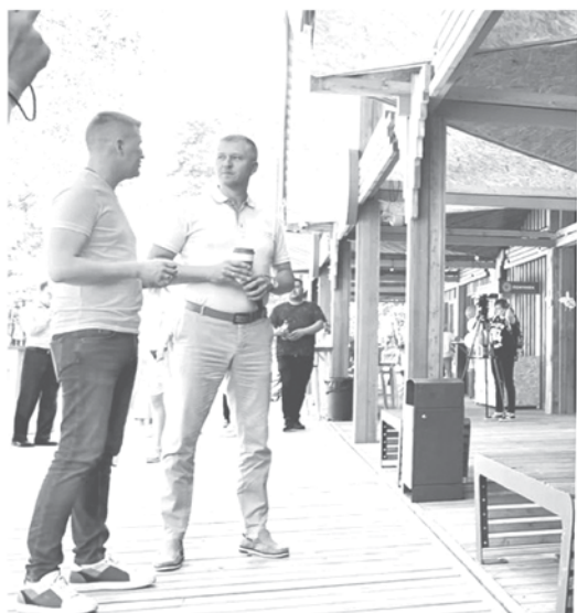
Новое кафе украсило Приморский парк в Сосновом Бору

Среди других разработок наших айтишников – инфомат для центров занятости, навигатор мер поддержки малого и среднего бизнеса.