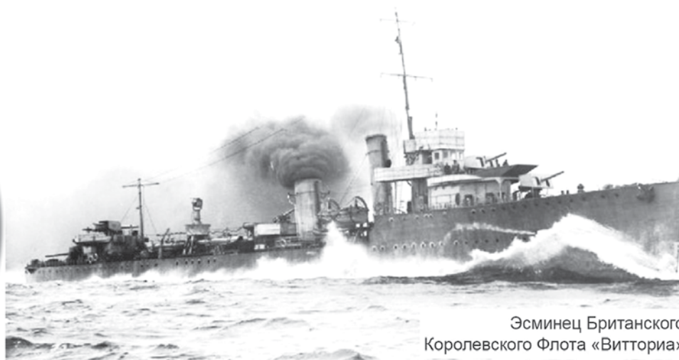
Эсминец Британского Королевского Флота «Виттория»