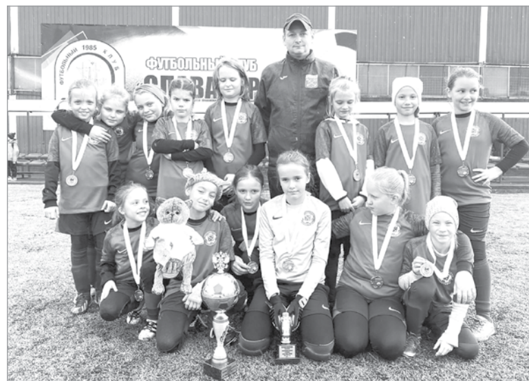
Команда «Ленинградец» – бронзовый призёр первенства

2 октября в поселке Металлострой на Первенстве Санкт-Петербурга по футболу среди девочек 2012 – 2013 годов рождения наши девочки завоевали «серебро».