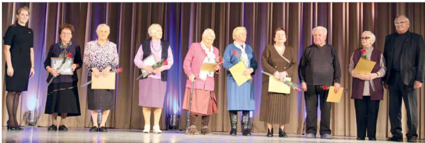
Награды – самым активным ветеранам