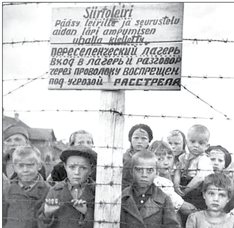
На фото советские дети – узники 6-го финского концлагеря в Петрозаводске. Фотография сделана военным корреспондентом Галиной Санько после освобождения Петрозаводска советскими войсками 28 июня 1944 года. Авторское название фотографии – «Узники фашизма». Этот снимок представлялся в составе доказательств на Нюрнбергском процессе над главными нацистскими преступниками.

ское руководство Финляндии поставило перед своей армией ограниченную задачу – только вернуть финские территории, отошедшие к СССР по итогам советско-финского вооруженного конфликта 1939 – 1940 годов, был придуман финскими историками задним числом. Историческая правда заключается в следующем: на Карельском перешейке финские войска были остановлены на передовой линии Карельского укрепрайона (КаУР), рубежи которого проходили по старой финской границе.